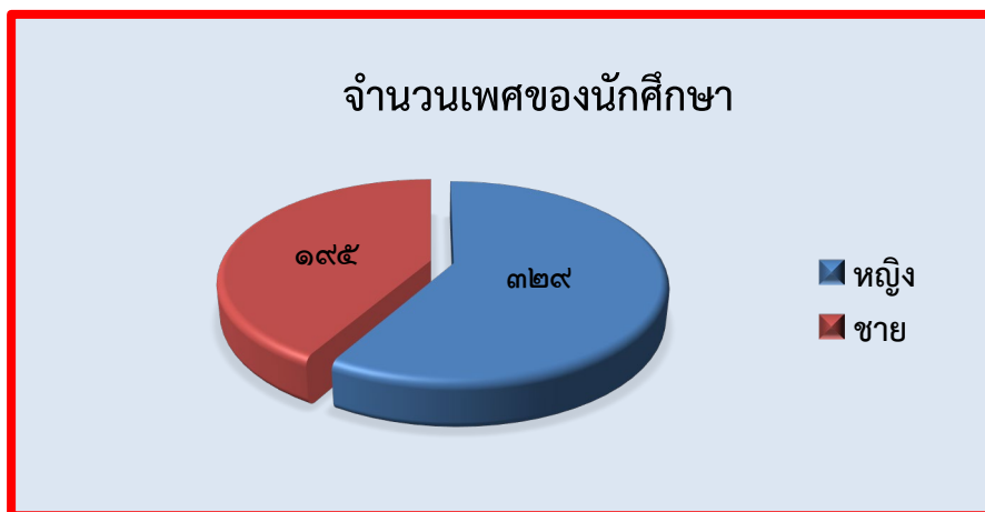
แผนภูมิที่ 2 จำนวนเพศของนักศึกษา